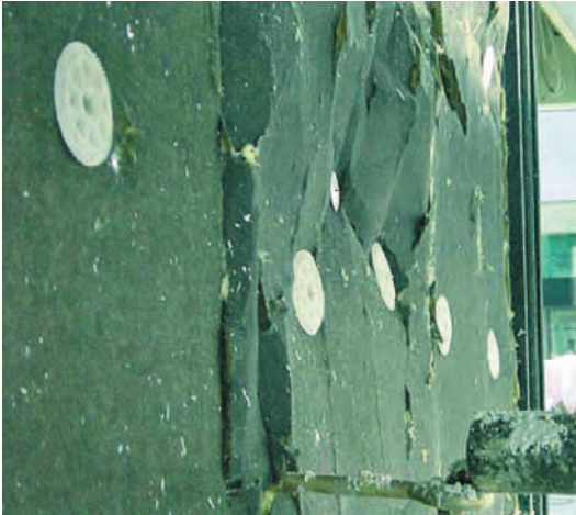
Abb. 8.4: Schon in der Bauphase hat dieses Wärmedämmverbundsystem so viel Wasser aufgenommen, dass es sich wellt (Steppdeckeneffekt). Dadurch kann es seine Dämmfunktion kaum noch erfüllen.

Bei offenzelligen Dämmstoffen sind Belüftung und Luftströmung hinter der Verkleidung Voraussetzungen für eine funktionierende Dämmung. Das Fraunhofer Institut für Bauphysik hat festgestellt, dass es sonst immer zu Wärmeverlusten und Luftkonvektionseinflüssen kommt. Wenn die Dämmung auch noch aus der Form gerät, ist es um den Wärmeschutz schlecht bestellt.