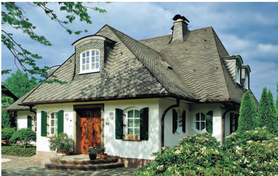
Abb. 1.2: Hier wurde bei der Modernisierung sorgfältig darauf geachtet, das ursprüngliche Aussehen zu erhalten.

Im Bestand gibt es derzeit fast 39 Millionen Wohneinheiten, davon rund 18 Millionen in Ein- und Zweifamilienhäusern. Seit 2001 werden mehr gebrauchte Immobilien verkauft als neue gebaut – mit steigender Tendenz. Außerdem werden in den nächsten Jahren hunderttausende Häuser vererbt. Der Trend beim Neubau geht zurück in die Stadt. Große, gut erhaltene Einfamilienhäuser in ländlichen Gegenden mit wenigen Arbeitsplätzen werden teilweise schon für um die 75.000 € angeboten.