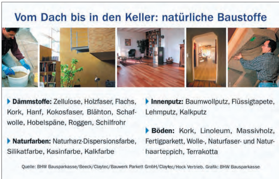
Abb. 8.1: Natürliche Baustoffe

Bei Wärmedämm-Verbundsystemfassaden ist oft die Haltbarkeit ein Problem (siehe folgenden Abschnitt über die Schwachpunkte von Dämmstoffen).