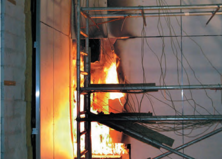
Abb. 8.9: Glaswolle oder Mineralfaser brennt schon nach kurzer Zeit lichterloh.

Auch entsprechend behandelter Zellulosedämmstoff hat gute Eigenschaften im Brandfall: Die Oberfläche einer beflamten Probe verkohlt, aber sie selbst verbrennt nicht. So wie Korkeichen durch eine dicke Korkrinde einen Waldbrand überleben können, verhalten sich Baustoffe wie Holz und Schaumglas ähnlich.