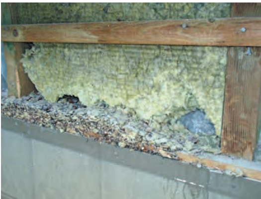
Abb. 8.5: Nager haben die Dämmung teilweise weggefressen, was zu hohen Wärmeverlusten führt. Viele Dämmstoffe bieten Mäusen, Ratten und Insekten zu wenig Widerstand.

Ein weiteres Problem sind Tiere: Testergebnisse zeigen, dass es kaum einen Dämmstoff gibt, der dem Nagetrieb von Mäusen und anderen Schädlingen standhält. Das gilt z. B. für Mineralfaserdämmstoffe, aber auch in Hobelspänen, Holzwolle und Holzfaserdämmplatten nisten sich Nager und Insekten gern ein.