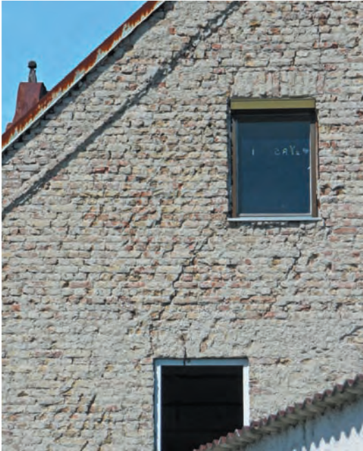
Abb. 1.3: Dieses marode Mauerwerk mit vielen Rissen legt die Frage nahe, ob sich die Statik noch retten lässt und eine Sanierung sich noch lohnt. Vielleicht wäre ein (Teil-)Abriss und Neuaufbau wirtschaftlicher.