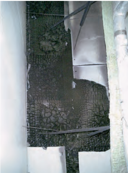
Abb. 8.10: Schaumglas bleibt nach dem Brand in der Substanz erhalten, die Oberfläche ist nur teilweise angeschmolzen.

Auch entsprechend behandelter Zellulosedämmstoff hat gute Eigenschaften im Brandfall: Die Oberfläche einer beflamten Probe verkohlt, aber sie selbst verbrennt nicht. So wie Korkeichen durch eine dicke Korkrinde einen Waldbrand überleben können, verhalten sich Baustoffe wie Holz und Schaumglas ähnlich.