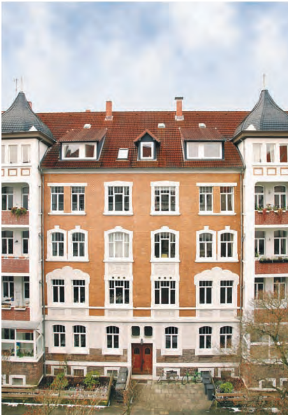
Abb. 1.5: Sanieretes Mehrfamilienhaus; viel Aufwand wurde betrieben, um die ursprüngliche Fassade zu erhalten.

Bei der Beurteilung von Bauschäden, einem Umbau oder einer Sanierung brauchen die meisten Hauskäufer professionelle Unterstützung von einem mit Umbauten erfahrenen Architekten. Hilfreich bei dessen Auswahl ist, wenn Sie sich vorher Referenzobjekte zeigen lassen und die jetzigen Eigentümer zum Umbau befragen.