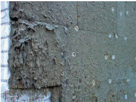
Abb. 8.3: Durchnässte Mineralfaserplatten: Schon wenige Prozent Feuchtigkeit im Dämmstoff verschlechtern die Dämmeigenschaften deutlich.