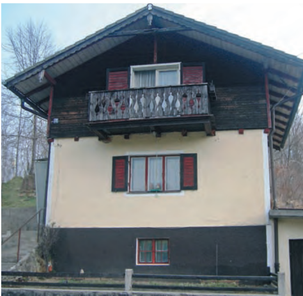
Abb. 1.4: Altbau aus den 20er-Jahren mit marodem Dachstuhl, feuchtem Keller, veralteter, korrodierter Elektro- und Sanitärinstallation, undichten Fensterrahmen mit Einfachverglasung und fehlendem Wärmeschutz. Abriss und Neubau sind geplant, da die Kosten für eine Sanierung die für einen vergleichbaren Neubau übersteigen würden.