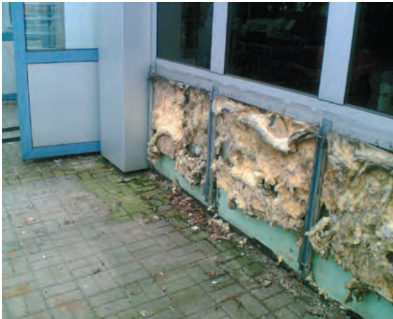
Abb. 8.2: Hinter eine Fassadenverkleidung ist Feuchtigkeit gedrungen. Die durchnässte Mineralfaserdämmung durchfeuchtet mittelfristig die Wand.

Was Hersteller gerne verschweigen: Witterungseinflüsse greifen viele Dämmstoffe nachhaltig an. Das unten stehende Bild aus einem Sanierungsfall zeigt einen durch anhaltende Einwirkung von Wasser und Wasserdampf völlig aus der Form geratenen und damit wirkungslosen Mineralfaserdämmstoff, der sehr viel Wasser aufgenommen hat. Hinterlüftete Vorhangfassaden sind winddicht zu dämmen, etwa durch Wasser abweisende Kaschierungen ohne offene Dämmplattenstöße und Fehlstellen. Sie sollten lückenlos an die Unterkonstruktion anschließen. Der Luftspalt zur Hinterlüftung der vorgehängten, hinterlüfteten Fassade muss gemäß DIN 18516 durchgehend mindestens 2 cm dick sein.