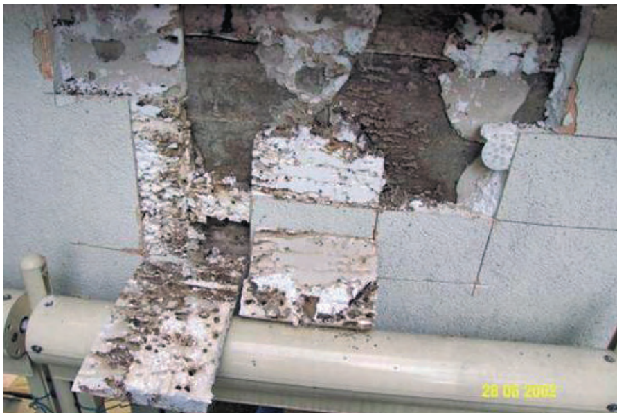
Abb. 8.6: Hier ist von der Dämmung nicht mehr viel übrig: von Insekten angefressenes Polystyrol.

Was Insekten oder Nager aus erdölbasierten Produkten machen können, zeigt das folgende Beispiel einer zerfressenen Polystyrol-Dämmung.