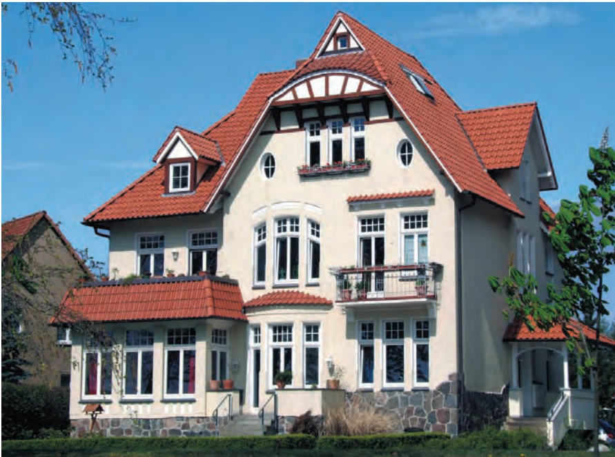
Abb. 1.1: Frisch renovierte Altbauvilla mit zahlreichen Vorsprüngen; diese machen zwar optisch Eindruck, jedoch geht über beheizte Anbauten im Vergleich zu einem kompakten, würfelförmigen Baukörper mehr Heizwärme verloren.

Wer sich für einen Altbau in Ostdeutschland interessiert, ist gut beraten, einen kritischen Blick auf den Dachstuhl zu werfen. Während der DDR-Zeit wurden fast alle Dachstühle mit teerhaltigen, sehr giftigen Holzschutzmitteln behandelt, die zum Teil sogar durch die Decken liefen.