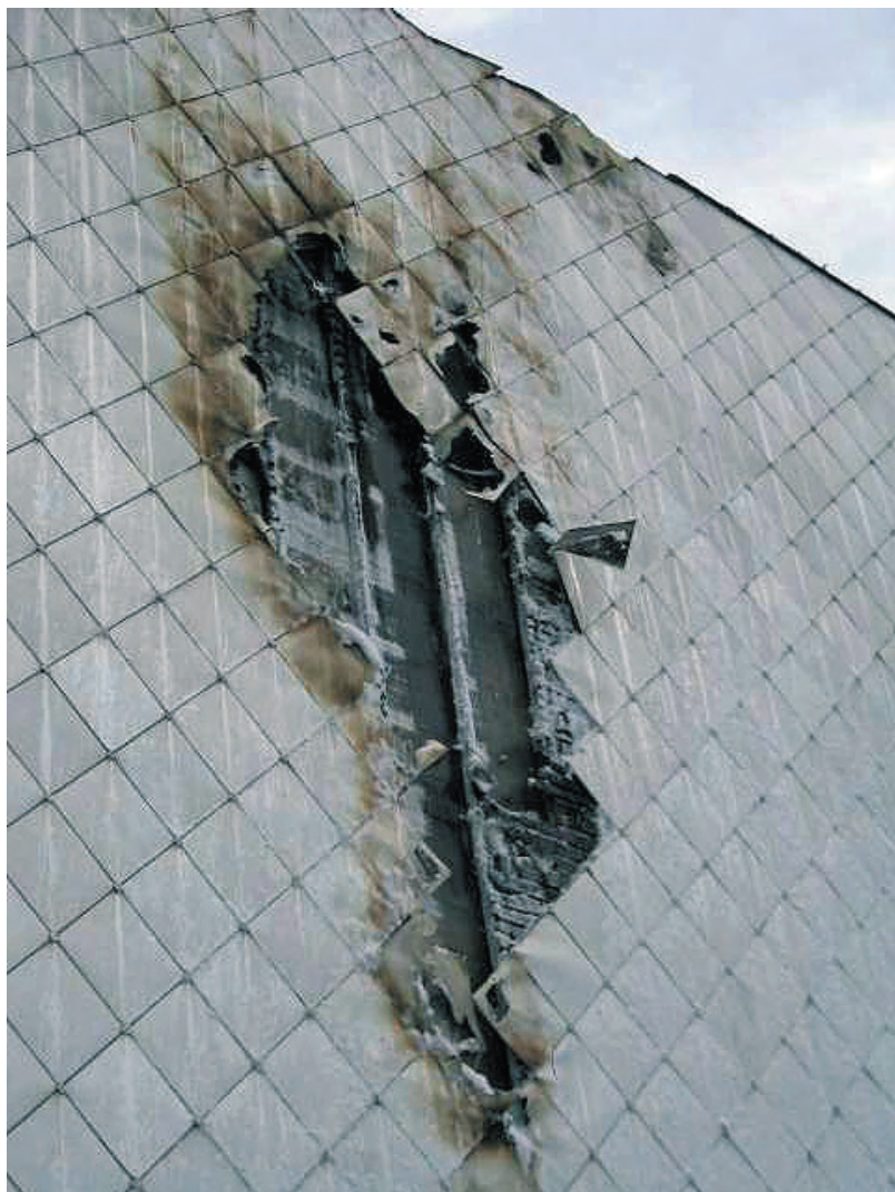
Abb. 8.7: Bei Deckarbeiten auf dem Dach züngelte die Flamme eines Propangasbrenners in den Fassaden-Hinterlüftungsraum und entzündete die Mineralfaserdämmung.